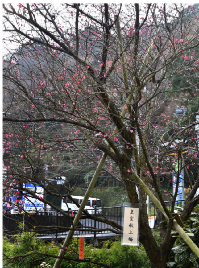
12 月 25 日撮影・梅園入り口初川側の八重寒紅（献上梅）